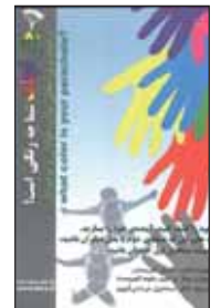
چتر نجات شما چه رنگی است

رضائی، مهدی. قلم در پابوس حرم. قزوین: سایه‌گستر. ۱۳۹۲.