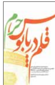
قلم در پابوس حرم

ضیغمی، محمدرضا. انگورهای هزار مسجد. تهران: کتاب ابرار. ۱۳۹۲.